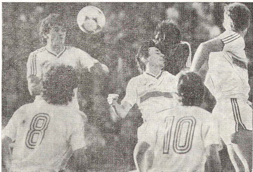
Матчи «Днепра» со «Спартаком» всегда отличает упорная игра. В борьбе за мяч сейчас больше спартаковцев (в светлой форме).