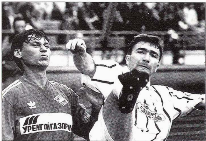
В упорной борьбе проходили матчи «Локомотива» и «Спартака» в прошлом сезоне.