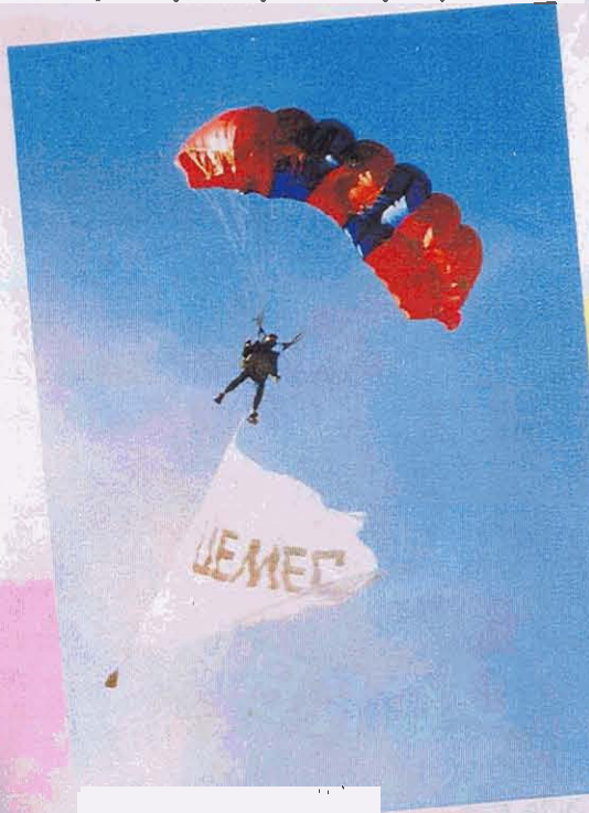
Когда в небе появились парашютисты, артисты от изумления упали на землю.