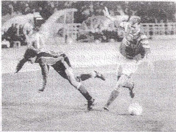
«Ротор» - «Спартак». 1997 год.

А происхождение флага спартаковцев таково. В 1927 году московская команда "Трехгорная мануфактура" выехала на зарубежное турне в Латвию, где она встречалась со сборной Союза Спорт Рабочих Латвии. Эти игры закончились убедительными победами гостей. Снаряжение советской команды было скромное, форма - невыразительная. Поэтому в спортивном магазине для команды купили ярко-красные майки с белой полосой вокруг груди. "Трехгорка" играла в этих майках несколько лет. Потом слава "Трехгорки" резко пошла на убыль, в конце концов она выбыла из первой московской лиги. В 1934 году команда "Промкооперация" выбрала себе красно-белую форму "Трехгорки", а в 1935 году общество "Спартак" ее утвердило. Отсюда и флаг общества - красное полотно с белой полосой по диагонали. А Латвия может гордиться тем, что причастна к данному факту.