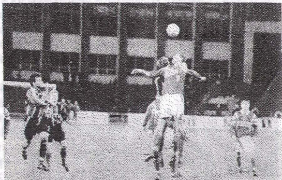
«Ротор» - «Спартак». 1997 год.

Большинство матчей сейчас можно уже относить к международным, а чисто российских было сыграно всего три. Два с “Кубанью” и один с “Шинником”, правда и из этих трех наши выиграли только один. По всем параметрам, сегодня будет крайне упорным матч. По идее наши не должны проиграть, но и выиграть им будет сложно. Но мы-то поможем “Ротору” своими глотками. А?