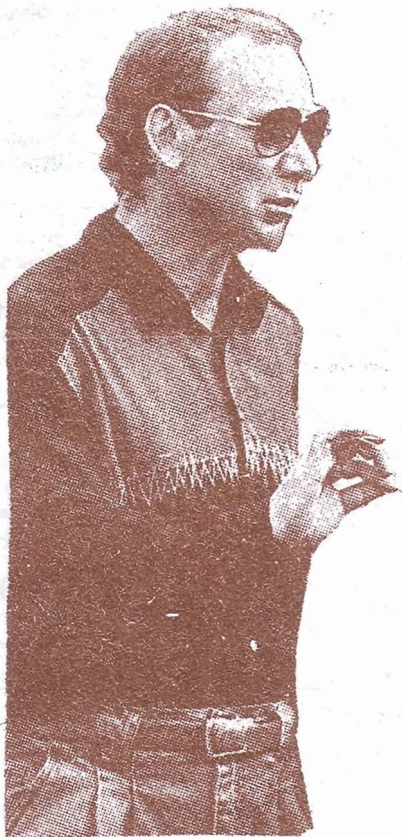
Олег Романцев: «В Бургасе всё спокойно...»