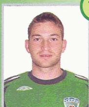
Динияр Марко (Хорватия) полузащитник