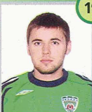
Мамаев Юрий (Россия) полузащитник