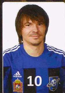
Лосков Дмитрий Амплуа: полузащитник Гражданство: Россия Дата рождения: 12.02.1974 Рост - 178 см, вес - 80 кг