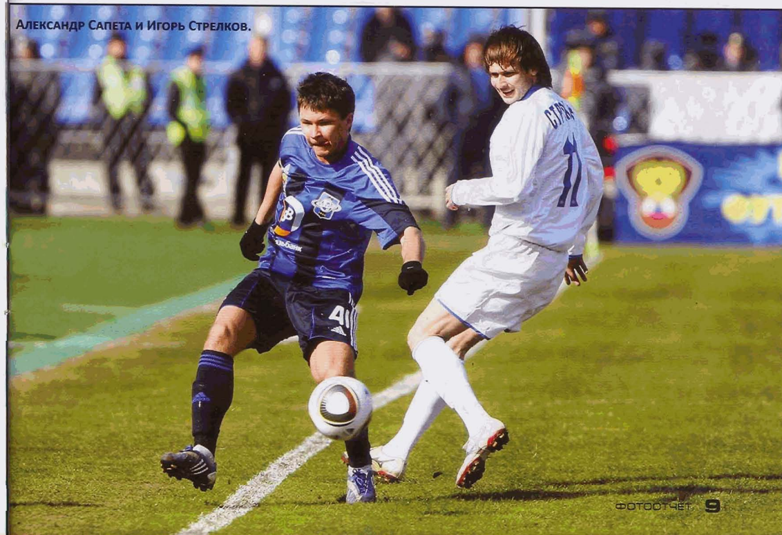
АЛЕКСАНДР САПЕТА И ИГОРЬ СТРЕЛКОВ.