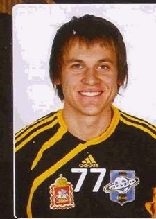
Ребров Артём Амплуа: вратарь Гражданство: Россия Дата рождения: 04.03.1984 Рост - 193 см, вес - 92 кг