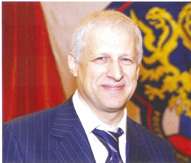
Президент РФС Сергей Фурсенко