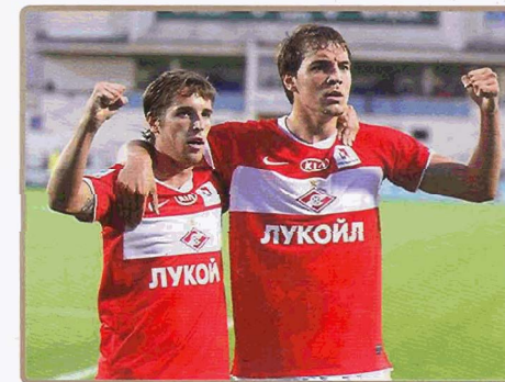
«СПАРТАК НАЛЬЧИК» — «СПАРТАК» — 1:1 (1:0)

Нальчик. Республиканский стадион «Спартак». 21.08.11 000 зрителей.