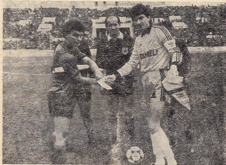
Первый матч «Спартак» в розыгрыше КЕЧ 1988/89 г. Капитан «Гленторана» Джим Клири и лучший вратарь мира 1988 г. Ринат Дасаев

Олимпийские игры несколько нарушили привычное течение европейских турниров. Встречи первого круга завершились лишь 12 октября. Из-за этого впервые в истории европейских кубков сразу семь матчей проводились после того, как состоялась жеребьевка игр второго круга.